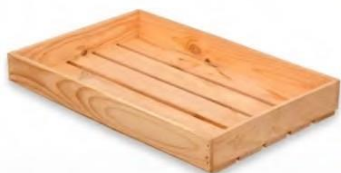
ЛОТОК ДЕРЕВЯННЫЙ КОНДИТЕРСКИЙ