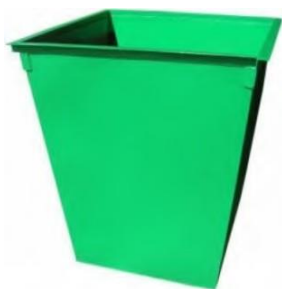
КОНТЕЙНЕР МЕТАЛЛИЧЕСКИЙ 0,75 куб.м. для ТБО