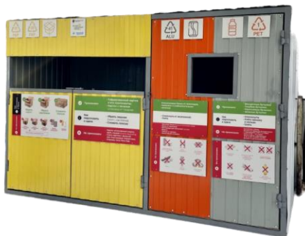
СТАНЦИЯ РАЗДЕЛЬНОГО СБОРА МУСОРА