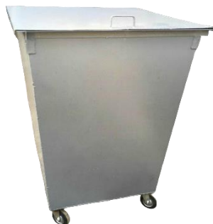
КОНТЕЙНЕР для ТБО (с крышкой и на колесах, цв. серый)