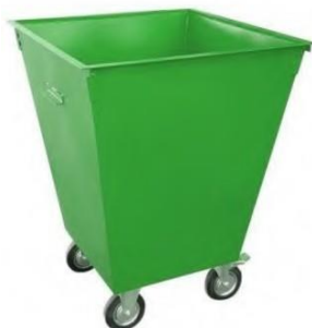
КОНТЕЙНЕР для ТБО (без крышки и на колесах)