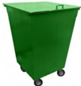
КОНТЕЙНЕР для ТБО (с крышкой и на колесах)