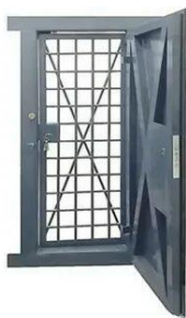
ДВЕРЬ ДЛЯ ОРУЖЕЙНЫХ КОМНАТ