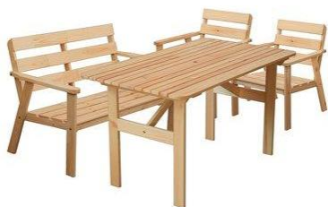
СКАМЕЙКИ И СТОЛЫ ДЕРЕВЯННЫЕ