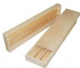
КЕРНОВЫЕ ЯЩИКИ ДЕРЕВЯННЫЕ