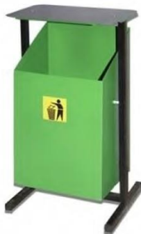
УРНА МЕТАЛЛИЧЕСКАЯ для МУСОРА