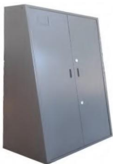
ПИРАМИДА МЕТАЛЛИЧЕСКАЯ ДЛЯ ОРУЖИЯ