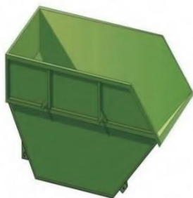
БУНКЕР НАКОПИТЕЛЬ для ТБО