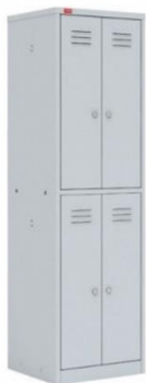
ШКАФ МЕТАЛЛИЧЕСКИЙ (С ЭЛ. ЗАМКОВ)