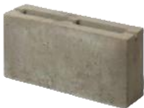
КАМЕНЬ ПРОДОЛЬНЫЙ ПОЛОВИНКА ПУСТОТЕЛЫЙ