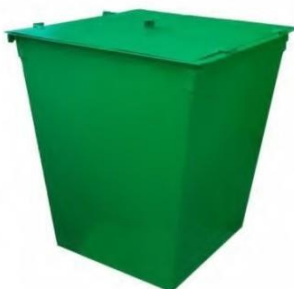
КОНТЕЙНЕР для ТБО (с крышкой и без колесного оснащения)