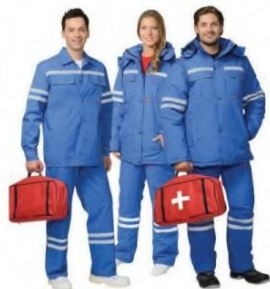
МЕДИЦИНСКИЕ ХАЛАТЫ, КОСТЮМЫ, КОМБИНЕЗОНЫ, СУМКИ РАБОЧИЕ