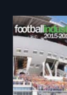
Каталог футбольная индустрия