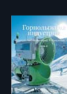
Каталог Горнолыжная индустрия