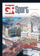
Журнал GR Sport