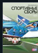
Журнал Спортивные сборы