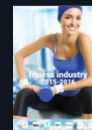
Каталог Фитнес индустрия