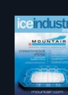
Каталог Ледовая индустрия

ГК SportB2B +7 495 640-87-30 www.sportb2b.ru