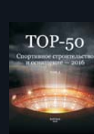
Каталог TOP-50 Спортивное строительство и оснащение