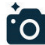
Фото и виде- осъемка на заказ

Продажа продукции собственного производства