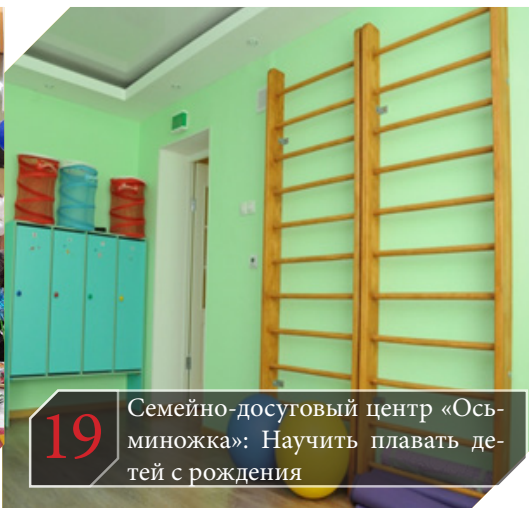
19 Семейно-досуговый центр «Осьминожка»: Научить плавать детей с рождения