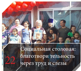
22 Социальная столовая: благотворительность через труд и слезы

Итоги года: Центр поддержки предпринимательства РС (Я)