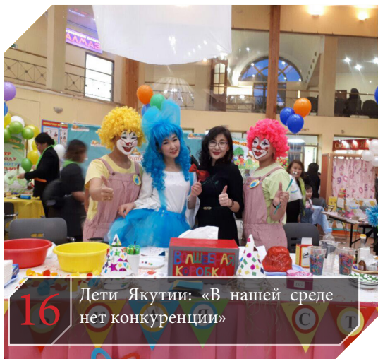
16 Дети Якутии: «В нашей среде нет конкуренции»