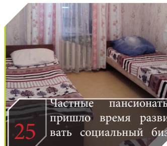
25 Частные пансионаты: пришло время развивать социальный биз-