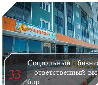
33 Социальный бизнес – ответственный выбор